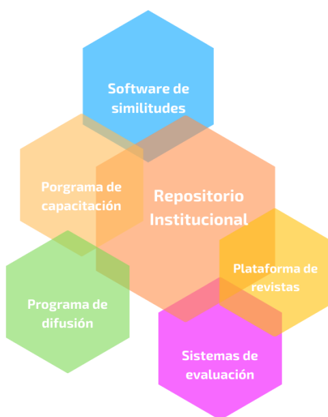
Figura 1. Ejes de trabajo Oficina de Ciencia Abierta, UAZ

Con esta inquietud se procedió a la oferta de 10 cursos hacia la comunidad docente, brindándolos desde el año 2017 en las Escuelas de Invierno y Verano promovidas por las autoridades de la UAZ y cada vez más bajo una agenda de trabajo por medio de solicitudes específicas de las Unidades Académicas que buscaban formar a su planta docente para la incentivación de la producción académica. Como resultado del aumento en la carga de trabajo y la importancia de las actividades para el año 2018 se promovió la creación de la Oficina de Ciencia Abierta, propuesta que fue apoyada para las autoridades universitarias en ese mismo año y que trabaja bajo seis ejes de acción continua: