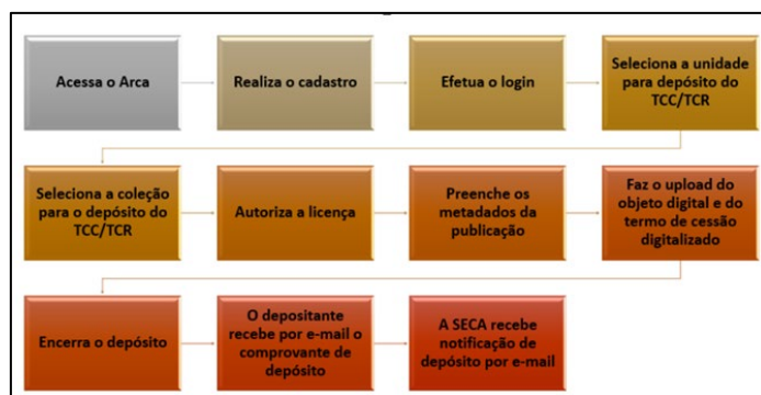
FIGURA 3. Competências do Discente

Em destaque os fluxos, apresentados nas FIGURAS 3, 4 e 5, propondo a inserção dos TCRs/TCCs com as competências de cada seguimento.