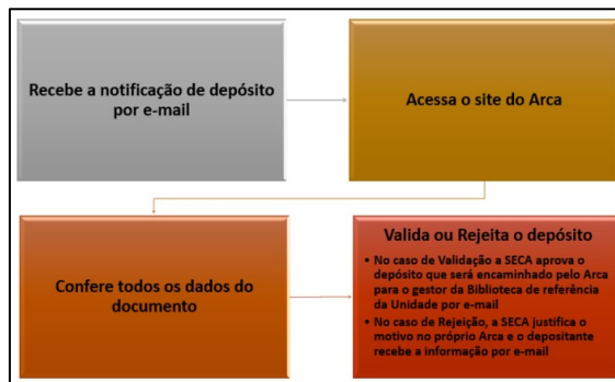
FIGURA 4. Competências da Secretaria Acadêmica (SECA)