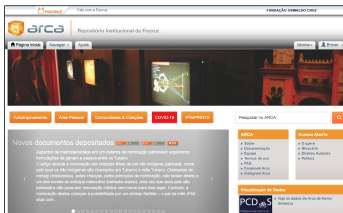
FIGURA 1. Arca - Repositório Institucional da Fiocruz ( www.arca.fiocruz.br )

A Rede de Bibliotecas da Fiocruz, pensando na melhoria dos processos para ampliação do Acesso Aberto e da Ciência Aberta na Instituição, em 2018 estabeleceu um Grupo de Trabalho para se debruçar sobre o tema. Em 2019 foi instituído um subgrupo para refletir sobre novos fluxos dos trabalhos acadêmicos para o Arca, considerando o autoarquivamento pelos alunos da instituição. Tendo em vista a importância da ampliação do acesso à produção científica dos TCCs/TCRs, o Fórum de Coordenadores e a Coordenação Adjunta de Residências - CGE da Vice-presidência de Educação, Informação e Comunicação (VPEIC) criou um Grupo de Trabalho para buscar soluções para o depósito desta tipologia documental no Arca, junto com o GT da Rede de Bibliotecas e a equipe executiva do Arca. Para a discussão do Projeto Piloto foram convidados os gestores da Biblioteca de Saúde Pública (ENSP), da Biblioteca de Manguinhos (ICICT) e da Biblioteca da Saúde da Mulher e da Criança (IFF).